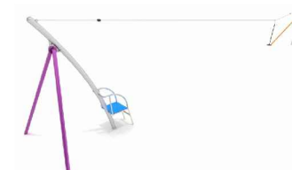
STREFA II DZIECI STARSZE 3–12